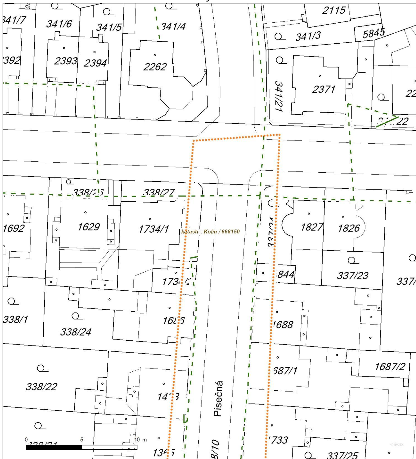
Situa ní výkres - list 1

Není-li zobrazena katastrální mapa, zadejte žádost znovu. Katastrální mapa je generována prostřednictvím externí WMS služby, jejíž provoz nezajišťuje společnost EZ Distribuce, a. s.